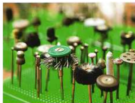
En hel liten skog av borrtillsatser erbjuder hjälp att få fram en mängd olika effekter när silverföremålet bearbetas.

– Jag syr och målar också, och har jobbat en del med textiltryck. Det är kul att pröva nya uttrycksmedel och det