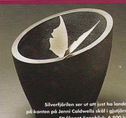
Silverfjärilen ser ut att just ha landat på kanten på Jenni Caldwells skål i gjutjärn. Ett fångat ögonblick, 6 800 kr.