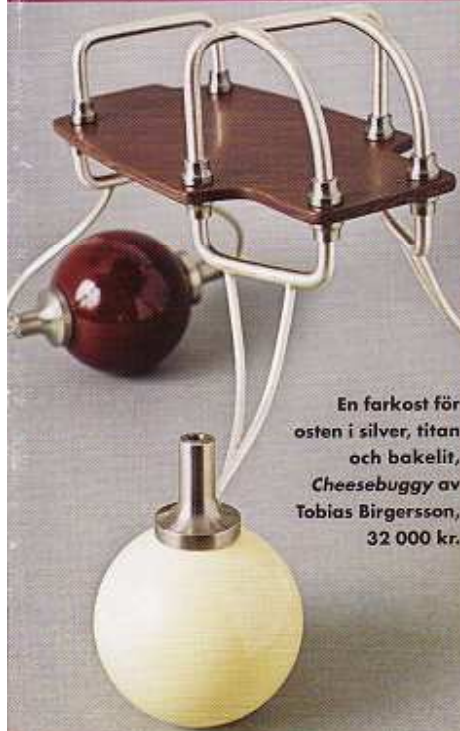
En farkost för osten i silver, titan och bakelit, Cheesebuggy av Tobias Birgersson, 32 000 kr.