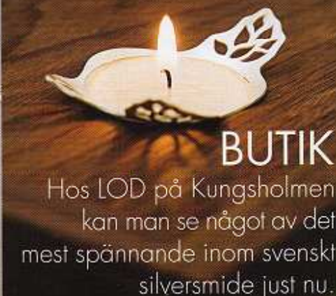
Bricka i valnöt smyckad med en ljushållare i silver, av Petronella Eriksson, 8 500 kr.